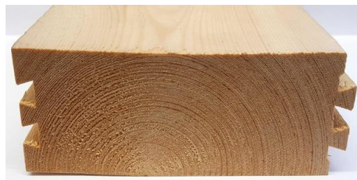
Pino nórdico („Pinus Sylvestris“) Bandejas myWood