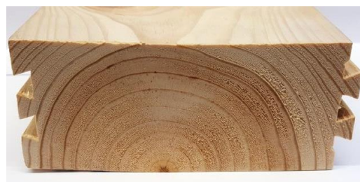
Pino mediterráneo („Pinus Pinaster“)